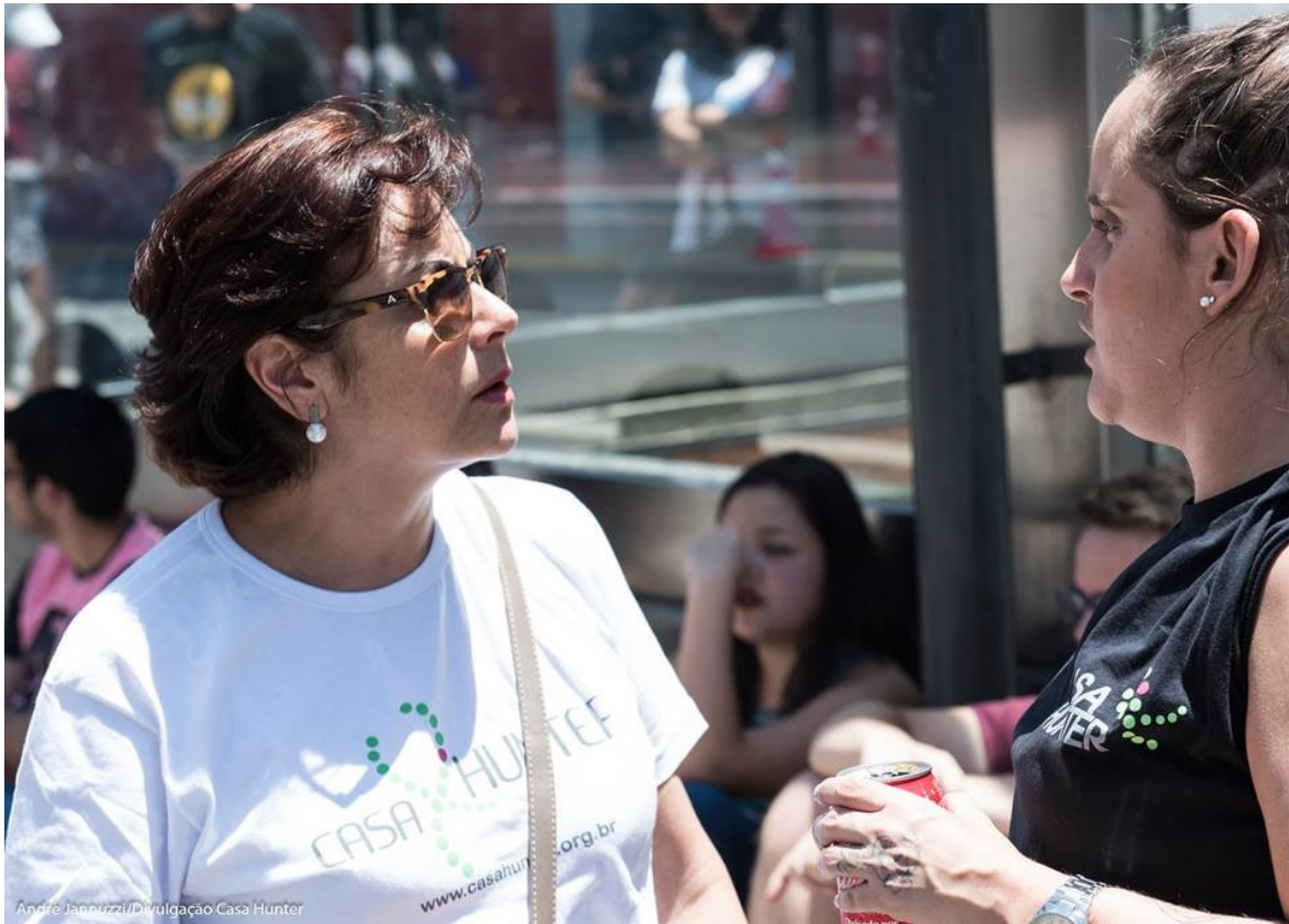
16/11 - (Quinta-Feira) - Reunião Anvisa